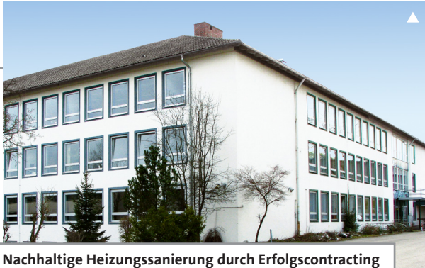
Nachhaltige Heizungsanierung durch Erfolgscontracting Naerco am Gymnasium Marktoberdorf

Hier wird erstmals ein neues Vergabeverfahren angewendet, bei dem die Einhaltung definierter Energie- und Qualitätswerte im Vordergrund stehen. Der Contractor garantiert deren Realisierung für 15 Jahre. Die Nutzer werden in die kontinuierliche Beobachtung der Einhaltung der Garantiewerte einbezogen.