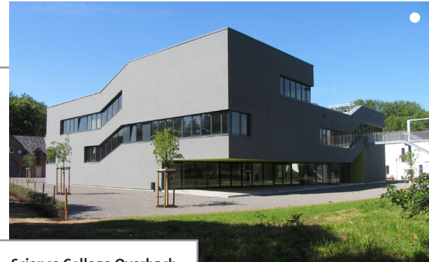
Science College Overbach

● nach der Fertigstellung ▲ vor der Fertigstellung