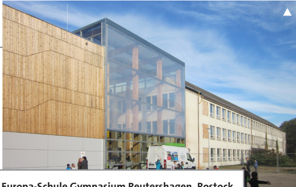
Europa-Schule Gymnasium Reutershagen, Rostock

Das Gymnasium und die angelagerte Grundschule sind sowohl anerkannte Europaschule als auch Ganztageschule und Förderstätte für besonders hochbegabte Schüler. Daraus resultieren Anforderungen an flexible Raumnutzung, daher soll hier auch ein neues räumliches Konzept entwickelt werden.