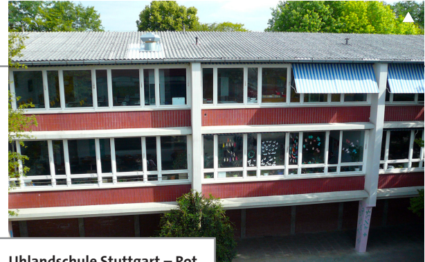
Uhlandschule Stuttgart – Rot

Hochwertiger Wärmeschutz, automatisierter mechanischer Sonnenschutz, Lüftungsanlage mit WRG, Photovoltaik, Solarthermie, Biogas, Biomasse, Fernwärme, Gebäudeleittechnik