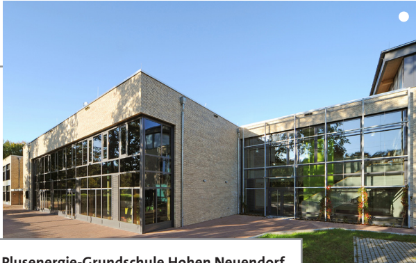
Plusenergie-Grundschule Hohen Neuendorf

Neubau einer dreizügigen Grundschule mit integrierter Sporthalle. Der Neubau schafft optimale bauliche Voraussetzungen für ein zukunftsfähiges Lern- und Lehrumfeld. Das Gebäude wurde mit dem Gütesiegel Nachhaltiges Bauen (BNB) des Bundes ausgezeichnet.